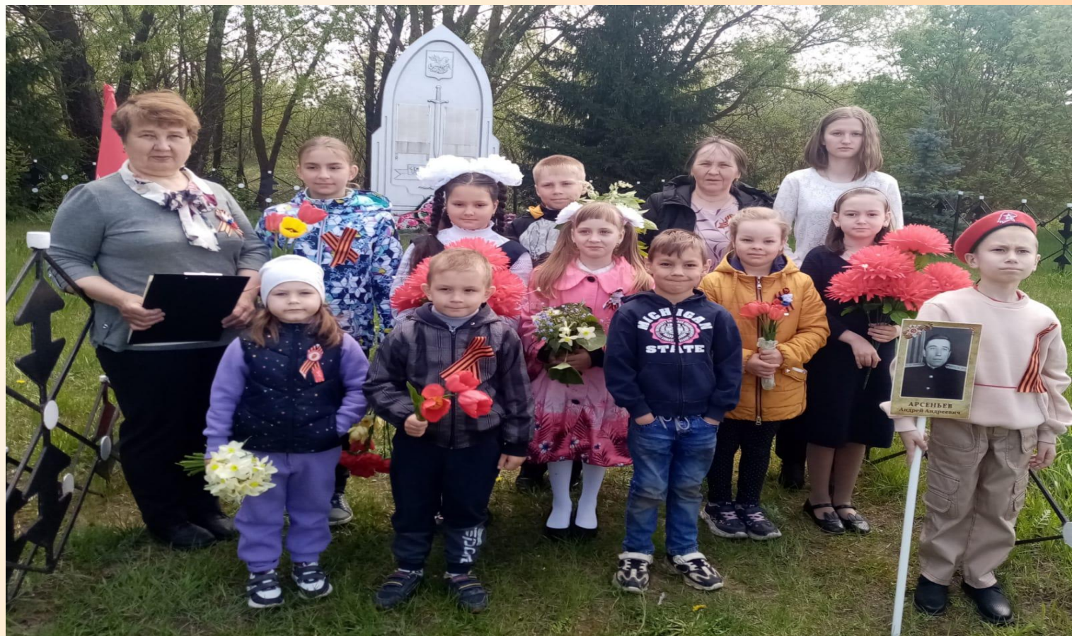
МИТИНГ у памятника 2022г.