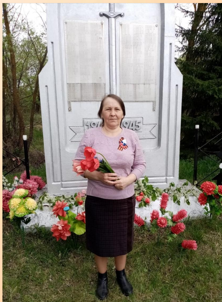
Возложение цветов к памятнику.