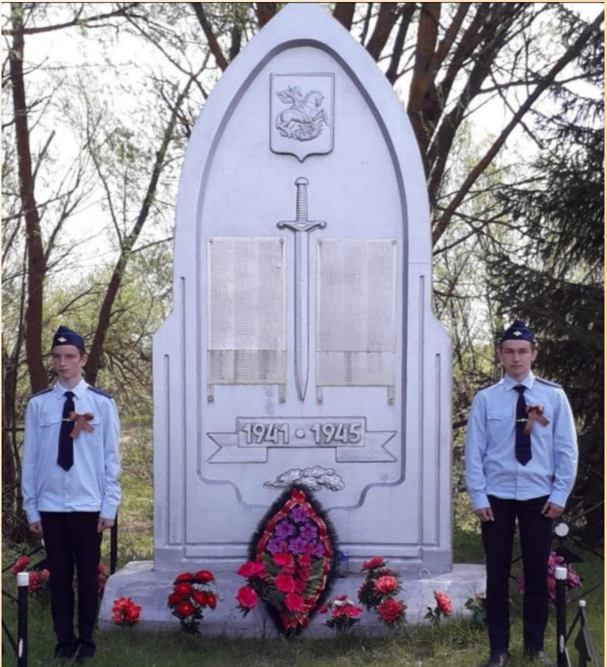
Вахта памяти 2021г.