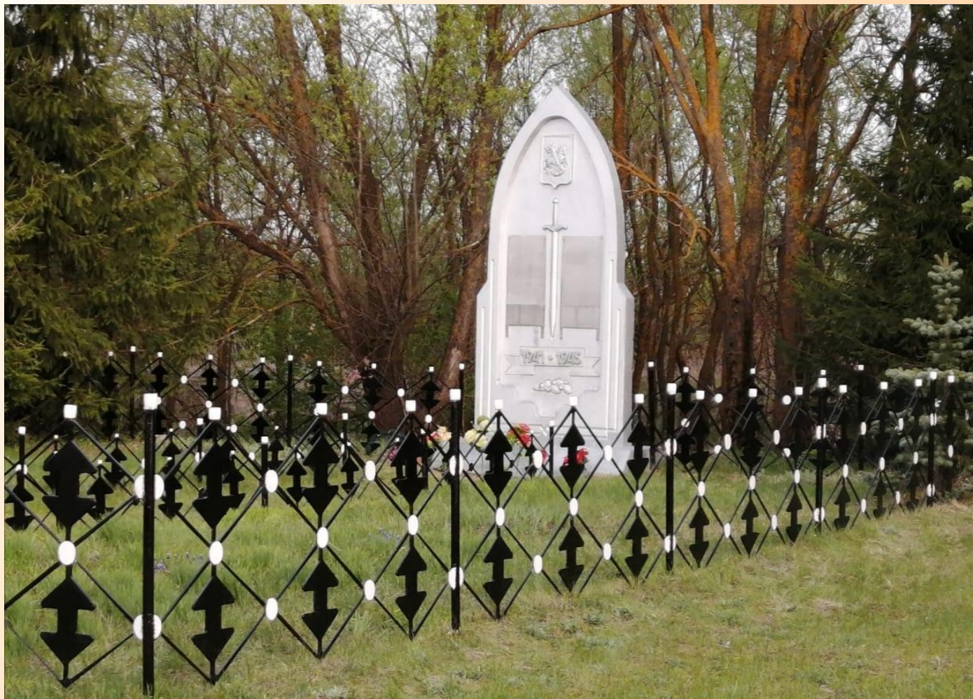
Памятник односельчанам, погибшим в Великой Отечественной войне 1941 - 1945 гг.